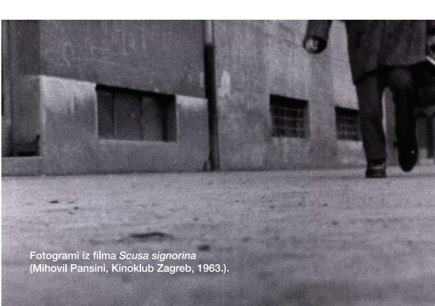
Fotogrami iz filma Scusa signorina (Mihovil Pansini, Kinoklub Zagreb, 1963.).

Predavanje se bavi utjecajem koje je odrastanje i sazrijevanje u otopnoj sredini imalo na Pansinijeve filmove, ali i na pozicioniranje njegova lika i djela u društveni kontekst.